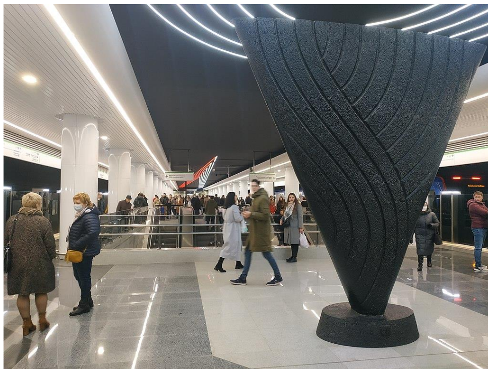
Рисунок 8 – Скульптура "ДЕРЕВО"

ветке метро, каждая станция по-своему уникальна и имеет свой запоминающийся образ.