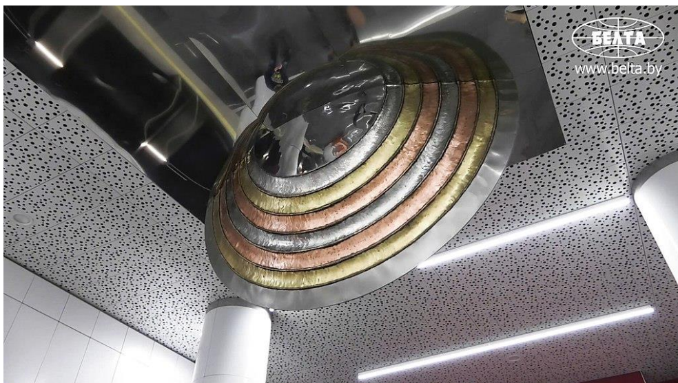
Рисунок 6 – Скульптура «СОЛНЦЕ»