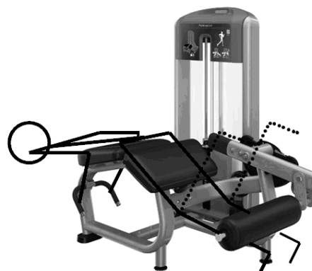
Рис. 3. Выполнение упражнения на тренажере Prone Leg Curl DSL0606

жения. Остальные суставы работают в режиме обеспечения осанки.