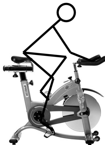
Рис. 8. Выполнение упражнения на велотренажере Teambike 800