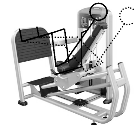
Рис. 4. Выполнение упражнения на тренажере Leg Press DSL0602