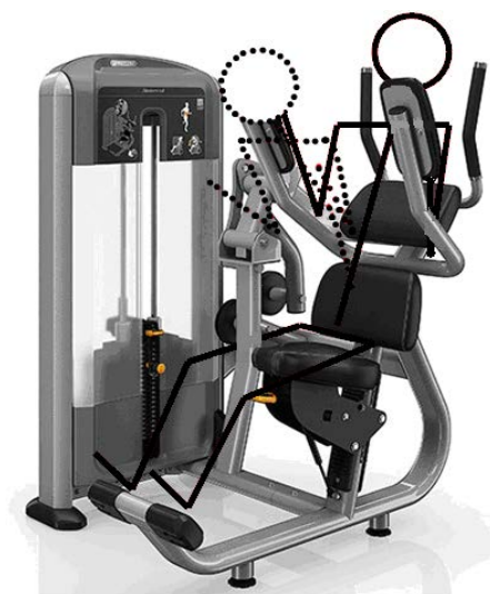
Рис. 6. Выполнение упражнения на тренажере Abdominal DSL0714

Рассмотренные тренажерные системы в качестве основы используют преодоление гравитационных сил. В то же время выполнение тренировочных упражнений включает в себя разгон и торможение поднимаемых грузов, что приводит к образованию инерционных добавок, которые зависят от ускорений, обеспечиваемых движениями звеньев тела.