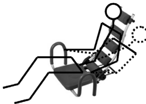
Рис. 7. Выполнение упражнения на тренажере AB Rocket*

Как правило, это различного рода велотренажеры (рис. 8), нагрузка в которых задается через управление силой трения, затрудняющей вращение педалей. Диссипативные тренажеры часто используют силы вязкости, возникающие при перекачивании жидкости между цилиндрами, а также при вращении лопастей винта, находящегося в воздушной среде (концепт).