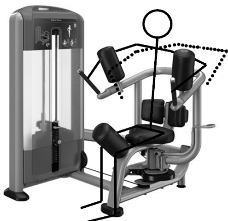
Рис. 5. Выполнение упражнения на тренажере Rotary Torso DSL0315

Упражнения, выполняемые на тренажере Rotary Torso DSL0315 (рис. 5), обеспечивают динамической нагрузкой суставы позвоночного столба (выделены в матрице серым цветом). Здесь нагружается одна степень свободы, относящаяся к ротационному типу суставного движения. Остальные суставы работают в режиме обеспечения осанки.