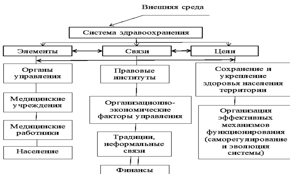
Рисунок 1 – Структура системы здравоохранения

Система здравоохранения состоит из элементов (это медицинские учреждения и кадры, органы власти и т. д.), связей и отношений между ними (прежде всего это финансовые взаимодействия и нормативно-правовые акты, регламентирующие эти интеракции), а также целей, ради достижения которых она существует (сохранение и укрепление здоровья граждан, поддержка системной эффективности и пр.) (рисунок 1).