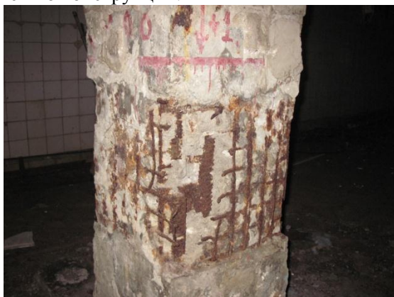
Рисунок 1. Фрагмент коррозии железобетонной колонны

Неблагоприятное сочетание постоянных и переменных нагрузок с воздействием различных физико-химических процессов среды вызывает коррозию бетона и стальной арматуры, что может привести к разрушению конструкций.