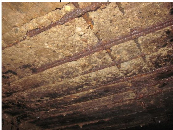
Рисунок 2. Фрагмент железобетонной плиты перекрытия (отслаивание и разрушение защитного слоя)

Долговечность элементов зданий и сооружений зависит во многом от степени агрессивности окружающей среды по отношению к материалам, из которых изготовлены конструкции, т.е. коррозионной стойкости этих материалов, проявляющейся в конкретных условиях эксплуатации. Развитие коррозии приводит к уменьшению размеров и площадей поперечных сечений элементов конструкций, к снижению их несущей способности и жесткости. Именно поэтому коррозия может являться причиной аварийного состояния ЖБК.