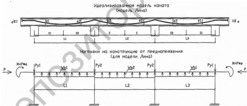
Рисунок 1. Идеализированная модель арматурного каната (по модели Лина)

Как правило, в статически неопределимых конструкциях напрягаемая арматура раскладывается в форме приближенной к эпюрам изгибающих моментов от равномерно распределенной нагрузки.