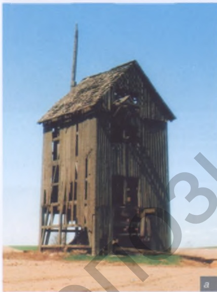
Мал. 5. Каркас з дрэва дазволіў выконваць ярусныя кампазіцыі званіц (а) і вежаў храмаў (б)