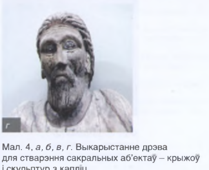
Мал. 4, а, б, в, г. Выкарыстанне дрэва для стварэння сакральных аб'ектаў – крыжоў і скульптур з капліц