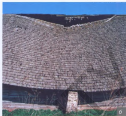
Мал. 2. Пакрыццё драўляных будынкаў: чаротам (а) і гонтай (б)