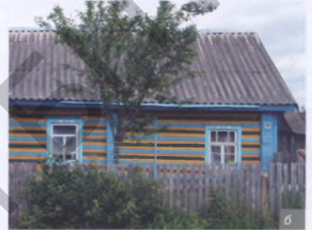
Мал. 9, а, б. Сучасная тэндэнцыя – рознакаляровая афарбоўка дрэва