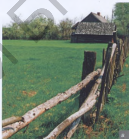
Мал. 3. Дрэва прысутнічае ў сялянскім асяроддзі ў выглядзе калодзежа (а), гаспадарчых пабудов і калёс (б), розных тыпаў платоў (в)

Прыродны, «драўляны» свет з цягам часу паўстае ўжо ў апрацаваным, штучным выглядзе культурнага асяроддзя беларуса: дамоў, гаспадарчых прыбудов, калодзежаў, агароджаў і розных рамесных і сельскагаспадарчых прыладаў (мал. 3, а, б, в).