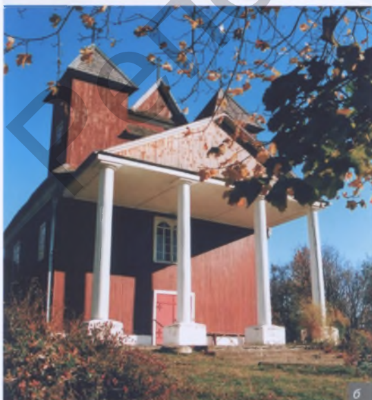
Мал. 7, а, б, в. Развіццё тэхналогіі дрэваапрацоўкі дазволіла выкарыстоўваць розныя формы і прыёмы ў драўляных пабудовах і інтэр'ерах