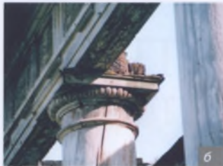
Мал. 8, а, б. Радзівілімонты – сапраўдны шэдэўр палацавай архітэктуры з дрэва